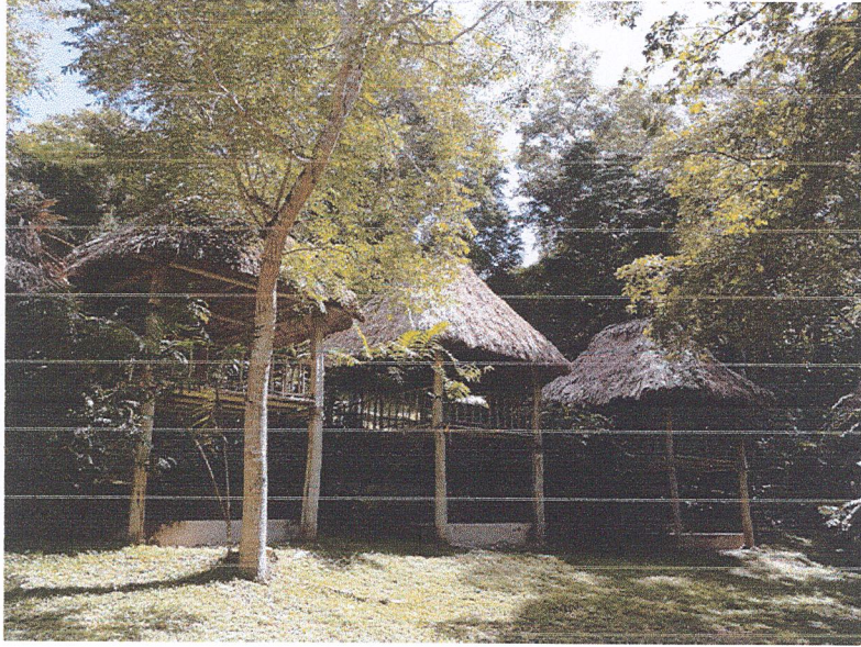
Fig.4: Se reemplazará e instalará nueva cubierta de guano y nueva estructura de madera para los techos en todos los bungalós.