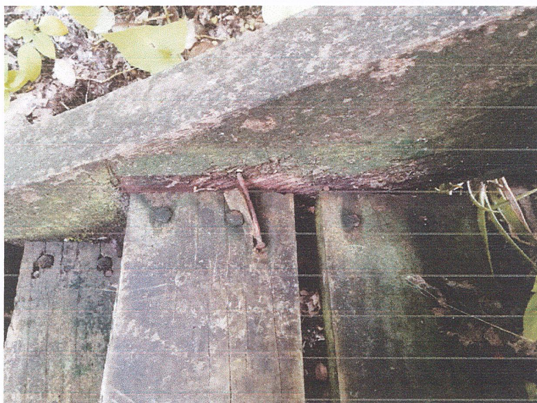
Fig.2: Se deberá reparar y reemplazar los escalones de varios módulos de gradas que son utilizadas para el ascenso a los edificios.