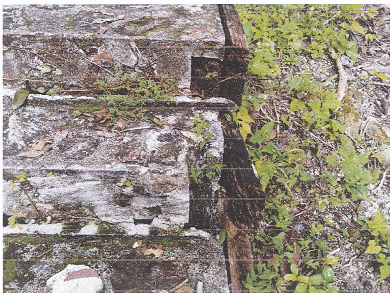
Fig.1: Se deberá reemplazar las piezas de madera que se encuentra en los costados y en contrahuellas de las gradas de la Calzada del Lago.