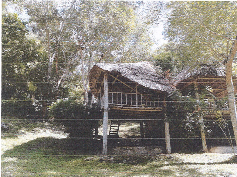
Fig.3: Estructura y cubierta en colapso en uno de los bungalós